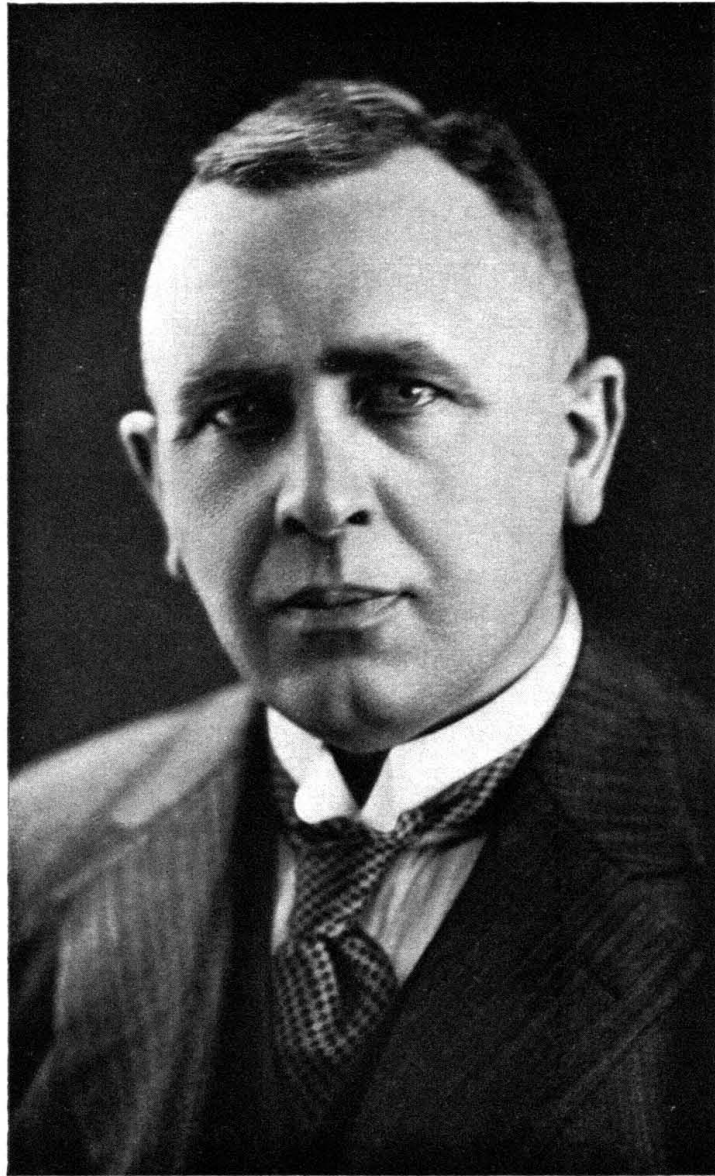
ZEGER WILLEM SNELLER (11 December 1882—10 November 1950)