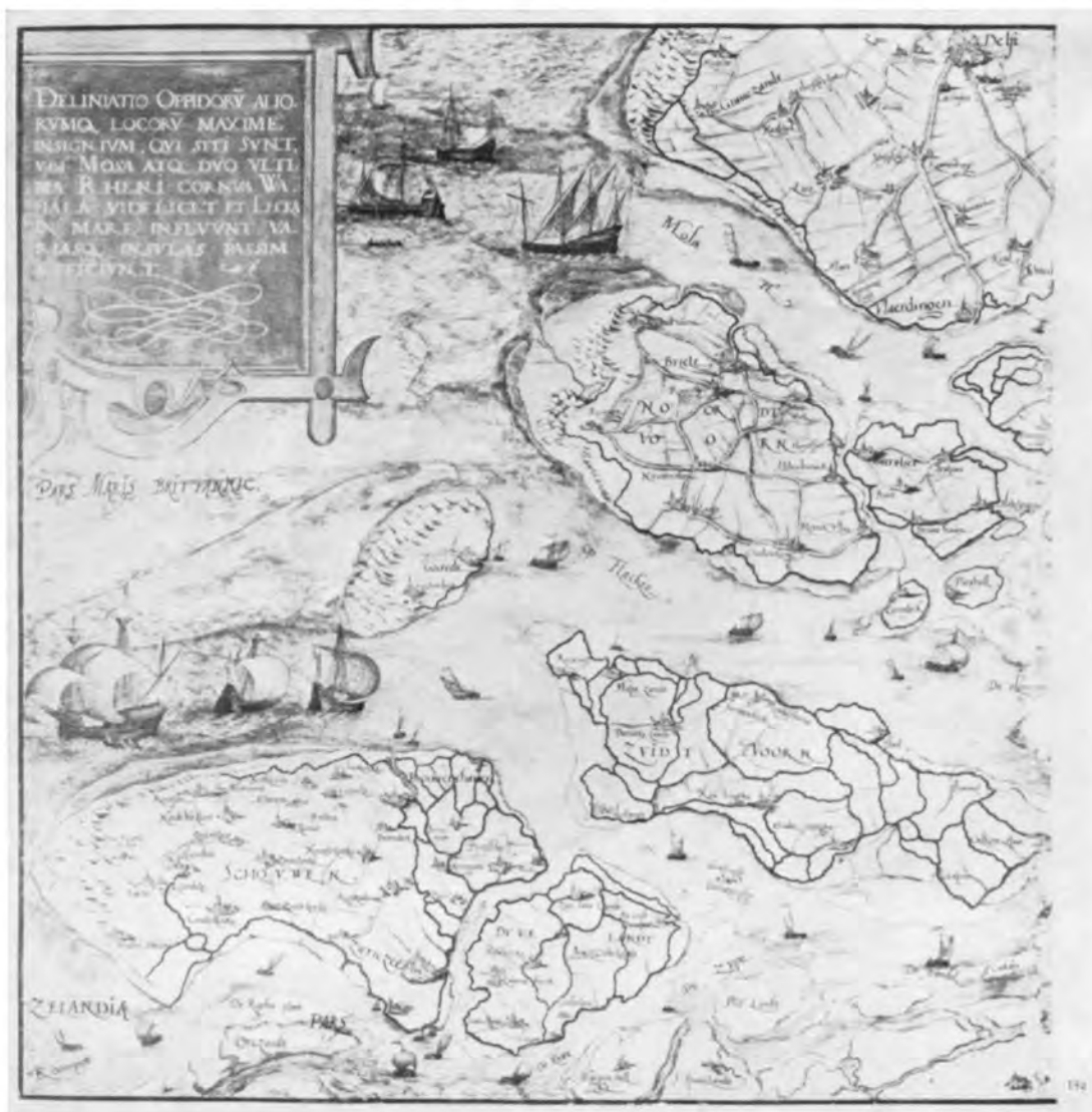
Afb. 12. De monding van de Maas ca. 1570. Blad 13a uit Christiaan Sgroten's Kaarten van de Nederlanden . Ed. E. J. Brill, Leiden 1961.