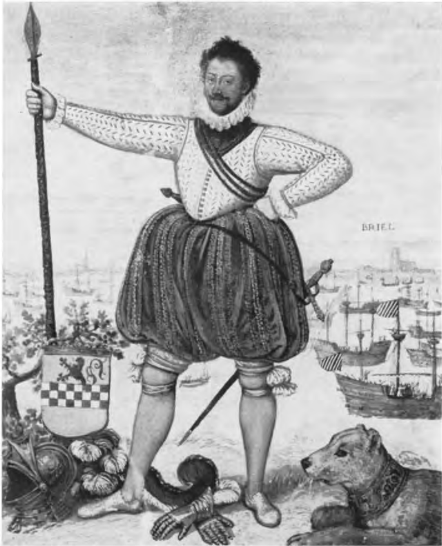
Afb. 1. Portret van Lumey met Den Briel en de Geuzenvloot op de achtergrond. De scheepsvlaggen zijn zwart-wit gestreept. Grote miniatuur in een handschrift opgemaakt door Diderik Wouterszoon van Catwijk, pastoor te Wassenaar, kort na 1572. Foto Algemeen Rijksarchief no. 32111.