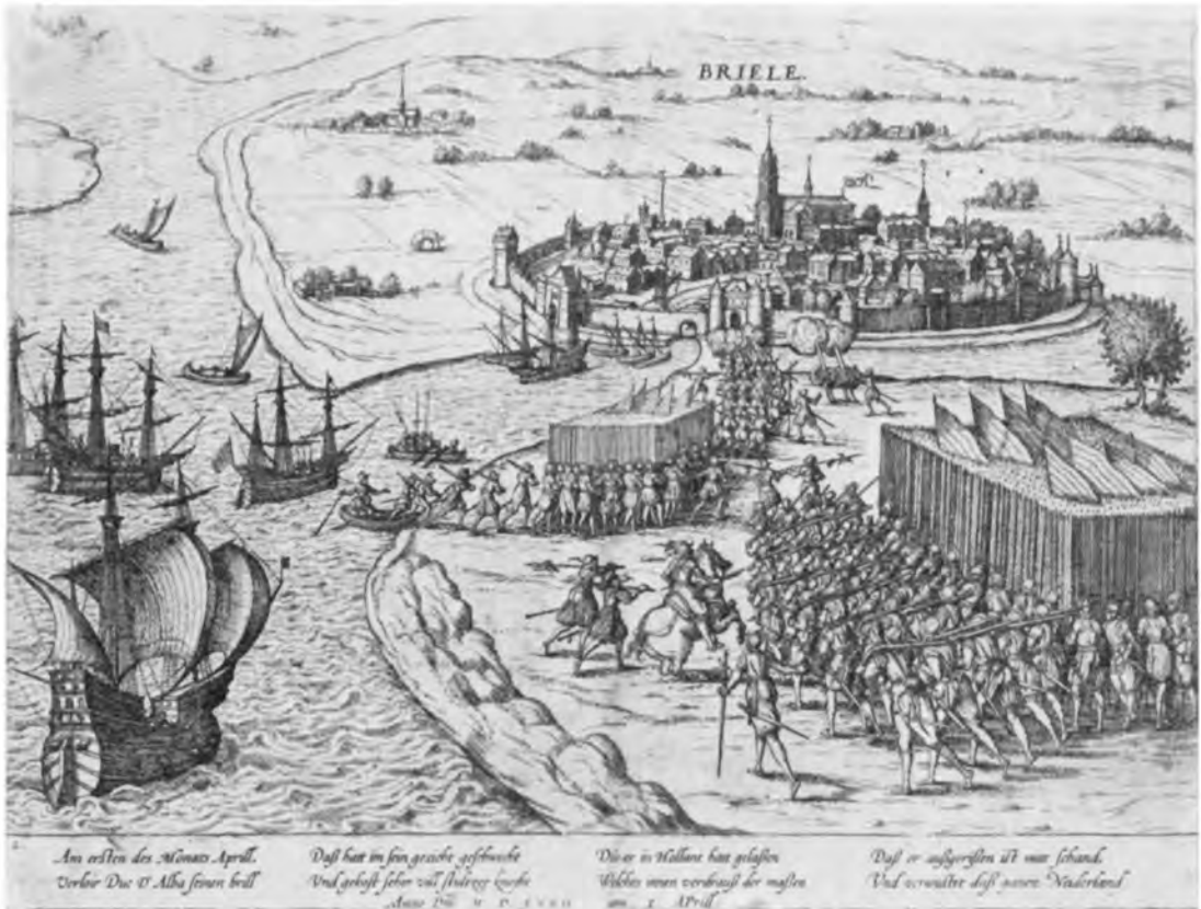
Afb. 7. De inneming van Den Briel, 1 april 1572. Gravure door F. Hogenberg.