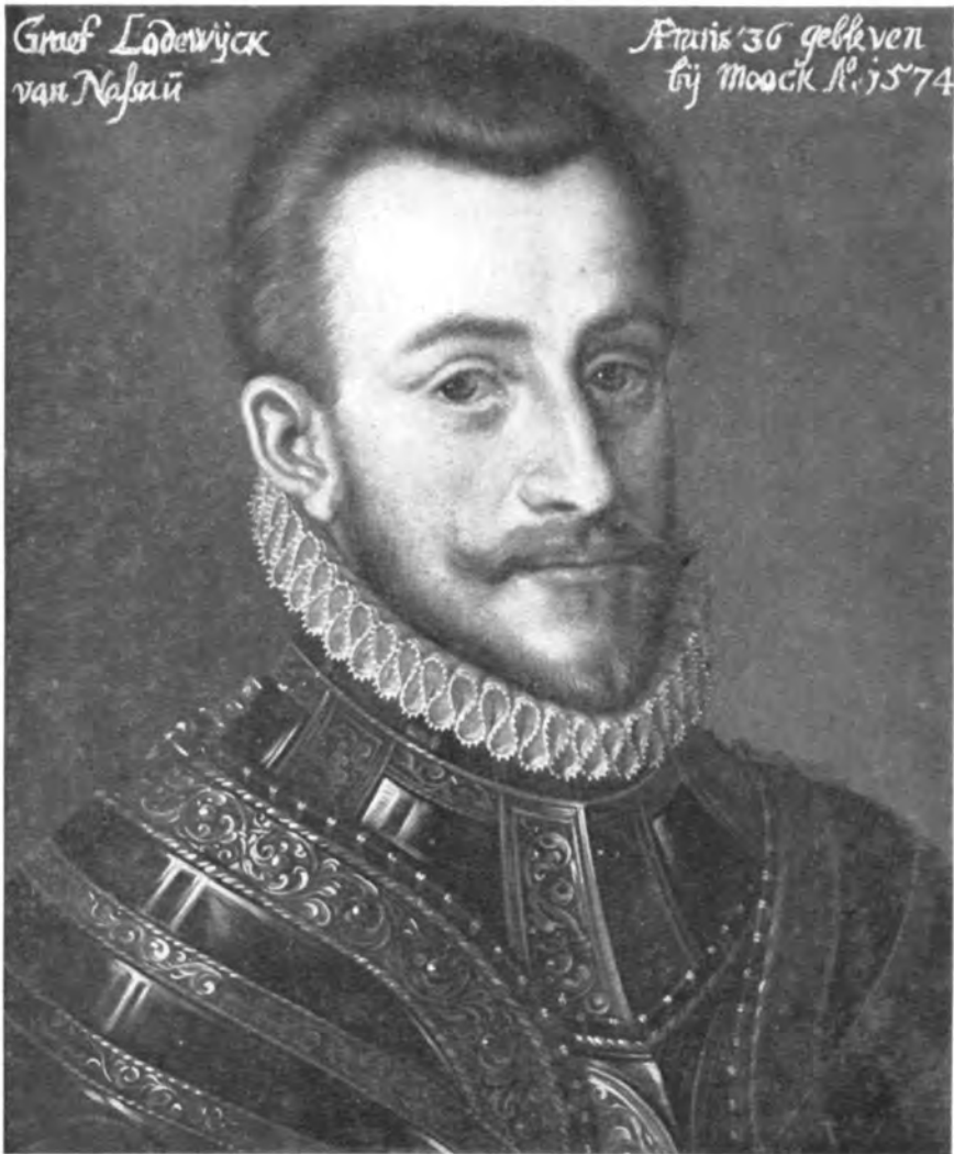
Afb. 5. Graaf Lodewijk van Nassau. Anoniem, begin 17de eeuw. Fotocommissie Rijksmuseum Amsterdam.