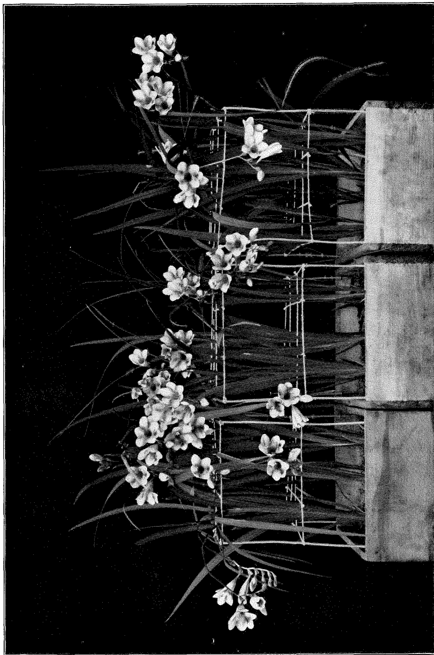
Fig. 1. Freesia hybrida var. Daffodil. 15 Juni 1937 ontvangen; 7 wk. 25\frac{1}{2}^{\circ} + 4 wk. 9^{\circ} ; 2 Sept. geplamt. Begin van den bloei 14 Dec.; foto 20 Dec. 1937.

Proc. Kon. Ned. Akad. v. Wetensch., Amsterdam, Vol. XLII, 1939.